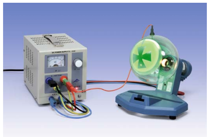
Fig. 2 Montaje experimental para la demostración de la propagación rectilínea de los electrones en el tubo de cruce de sombras