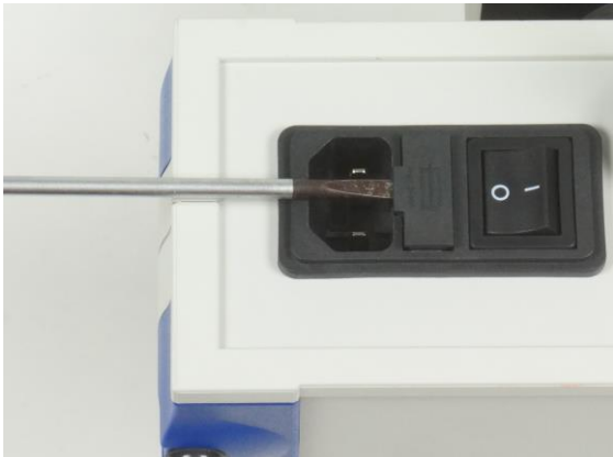
Fig. 1 Reemplazo de fusibles