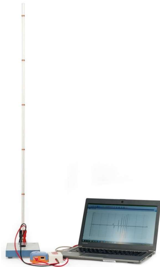
Fig. 1: Montaje de experimentación