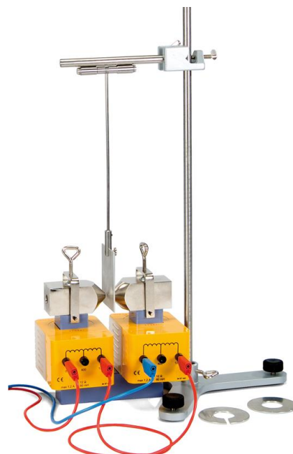
Fig. 2 Péndulo de Waltenhofen