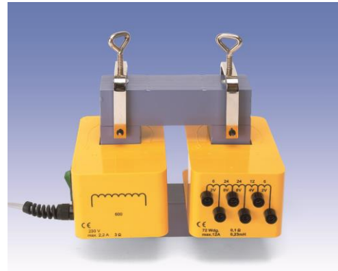
Fig.1 Transformador desarmable