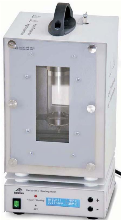
Fig. 1 Pared de horno con tubo de fluorescencia de sodio montada el horno calefactor