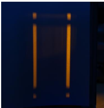
Fig. 2 Absorción de la luz de Na

En el tubo de fluorescencia de Na se produce una absorción casi completa de la luz de Na primaria. En contraste a ello, a uno y otro lado de la silueta aparece la luz directa que irradia a través del horno sin obstáculo entre la ventana y el tubo de vidrio.