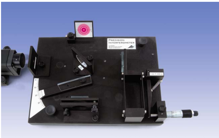
Fig.1: Montaje experimental para la medición del índice de refracción con un interferómetro de Michelson

Por medio de esta mínima modificación, el interferómetro de Michelson se convierte en uno de Twyman-Green, con el cual se puede determinar la calidad de las superficies de componentes ópticas. Normalmente se conoce un interferómetro de Twyman-Green como aquel en el cual el rayo de luz (de Láser) se ensancha y se hace paralelo. Para el entendimiento cualitativo del principio funcional se puede aplicar un rayo de luz ensanchado y no necesariamente paralelo.